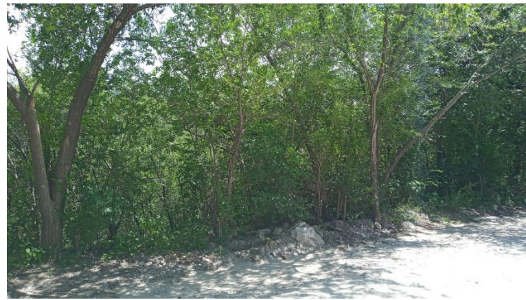
Vista desde calle Río Quinto